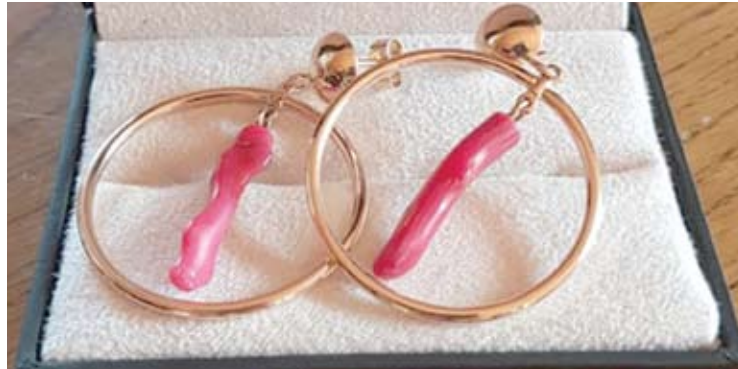
Meistras gamina papuošalus iš žalvario, bronzos bei brangiųjų metalų, inkrustuoja brangakmenius, auksuoja ir sidabruoja.