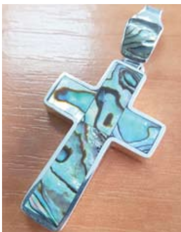
Autorinis Roberto Matiuko kūrinys.