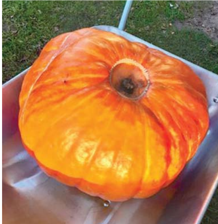
Ingos Karalienės užaugintas moliūgas.