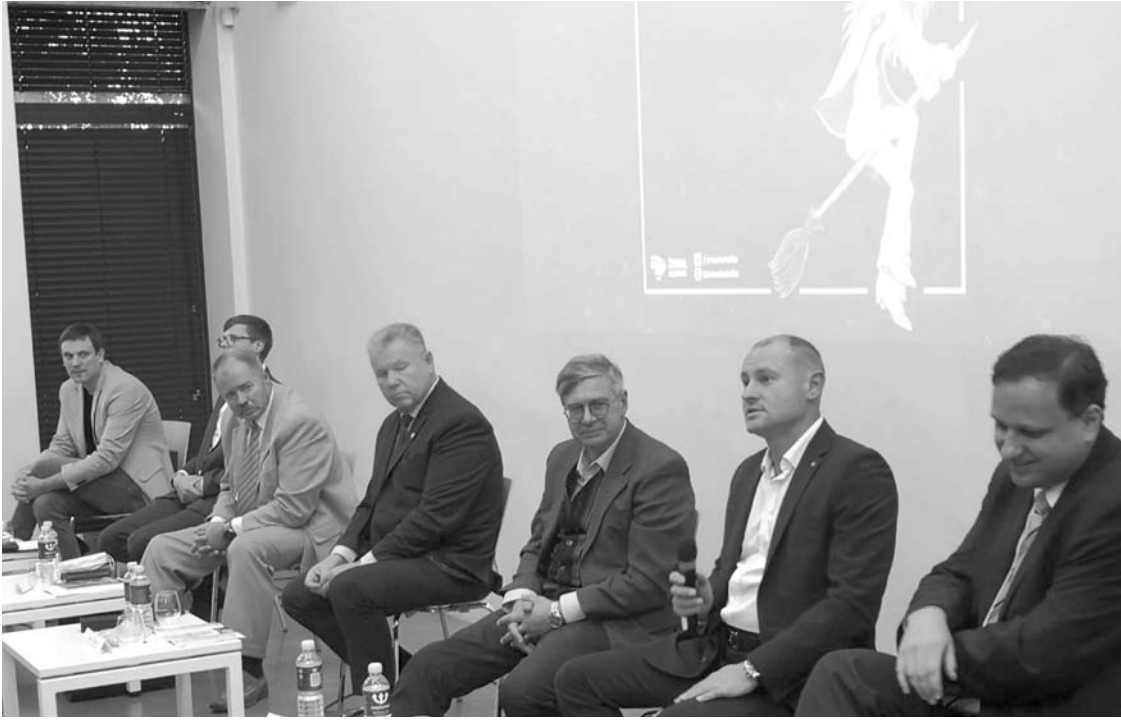
Kandidatų į Seimą Deltuvos šiaurinėje apygardoje diskusijoje dalyvavo septyni asmenys.