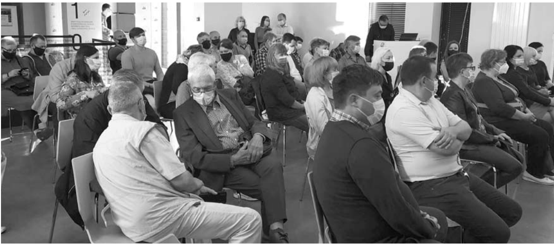
Didžioji dalis auditorijos buvo iš politikų palaikymo komandų.